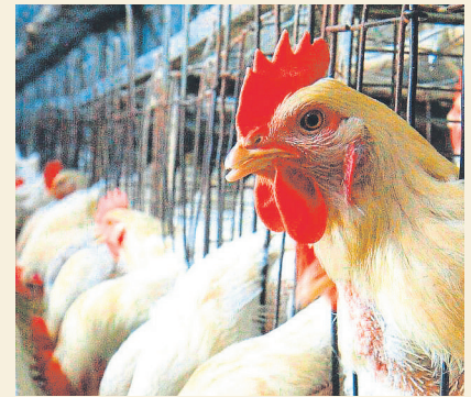
Die hoenders in.

Die nuwe voorgestelde teenstortingsregulasies sal teen einde November deur die Suid-Afrikaanse kommissie vir internasionale handelsadministrasie (Itac) gefinaliseer word, terwyl die kwota vir hoenderstukke aan die been uit die VSA voor einde van Desember deur die Suid-Afrikaanse Inkomstediens geskep sal word, het Medupe gesê. – Vida Booyen